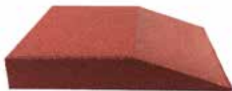
Rubber afgeschuinde tegel